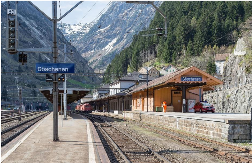
Abbildung A: Online abrufbar unter: https://upload.wikimedia.org/wikipedia/commons/1/13/Dampfzug_G%C3%B6schenen.jpg